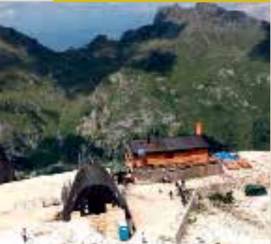
RIFUGIO PIAN DEI FIACCONI