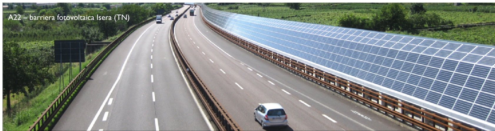
A22 – barriera fotovoltaica Isera (TN)

Le barriere antirumore al 31 dicembre 2015 contano ca. 84 km, mentre al termine degli investimenti si estenderanno per ca.187 km.