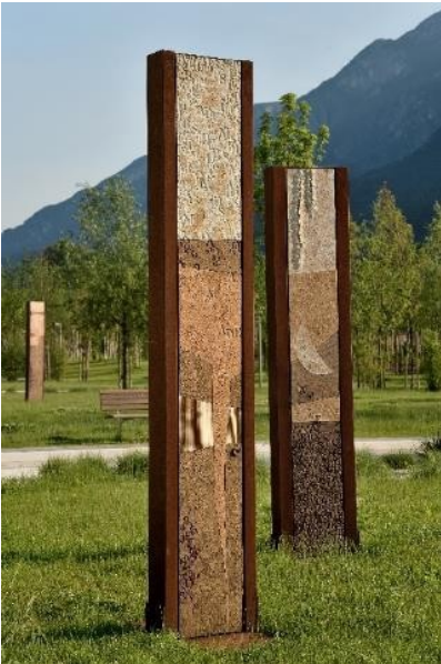
Foresta degli Oracoli Acciaio corten e semire 2008, cm.284-264-244