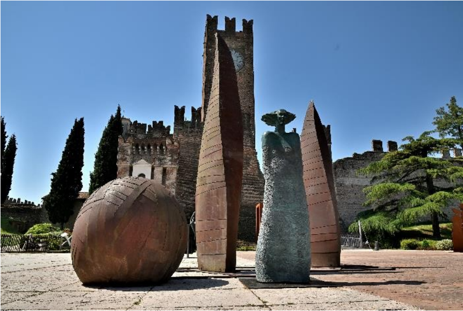
"Tra memoria e visione" - corten e resina, cm.460-360-210-140. anno 2007 -