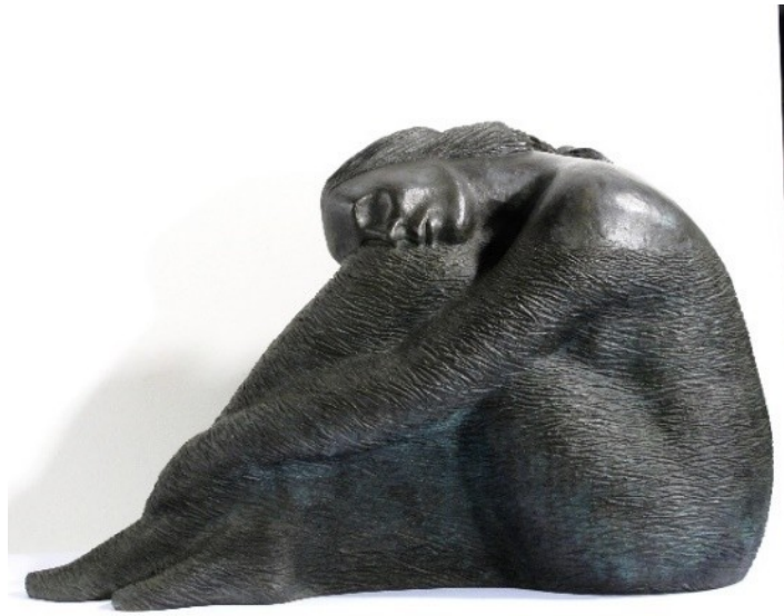
Equilibri Corten e bronzo 2023cm. 195 Sogno media bronzo 1997 - h. 81x51