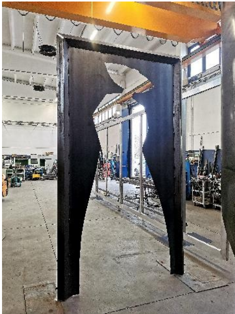
"Penelope" bronzo 2000 h. cm 71,6 12 Portali acciaio corten cm.300x150. 2026