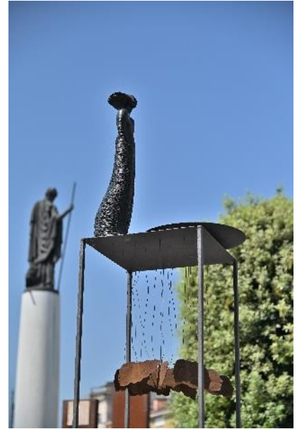
Origini Androgino corten 2019 - cm. 230 - h. cm. 258 - h. cm. 300 "Custode del tempio" bronzo e ferro 2010 h. cm. 250 "Custode del tempio" bronzo e ferro 2014- h. cm. 295