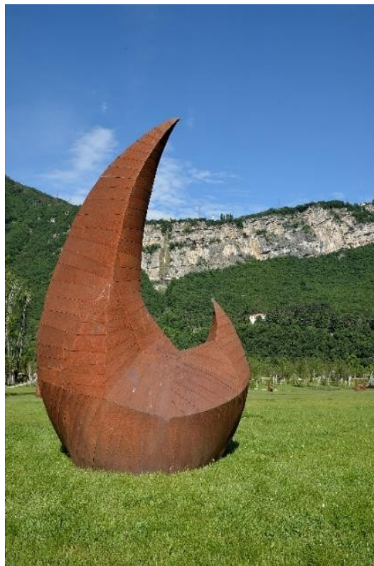
Finestra con Equilibri, corten e bronzo - 2019 cm. 240x124x87 Megalite, acciaio corten 2009 cm. 360x220