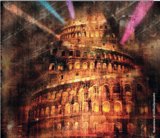
Illustrazione di Colosso/Divisart