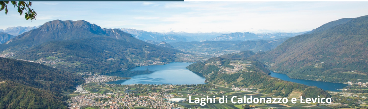
Laghi di Caldonazzo e Levico