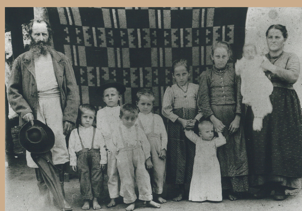
Famiglia trentina in Brasile, sec. XIX fine-sec. XX inizio

Non a caso, per fare un esempio, gli utenti localizzati in Brasile si trovano negli stati a maggiore presenza di discendenti di emigrati trentini (Sao Paulo, Santa Catarina, Rio Grande do Sul, Parana). Per i paesi europei, in particolare per Germania e Austria, si può presumere che vi sia una rilevante quota di ricerca storica, data l'appartenenza della provincia di Trento fino al 1803 al Sacro Romano Impero e poi fino al 1918 all'Impero asburgico, con la conseguente presenza sul territorio di fonti archivistiche (soprattutto archivi nobiliari) di interesse per l'area in questione. Un caso singolare e difficilmente interpretabile è quello delle consultazioni dall'Indonesia, attestate, pur se soltanto per il 2021, in misura superiore rispetto a quanto prevedibile sulla base dei rapporti esistenti con il Trentino.